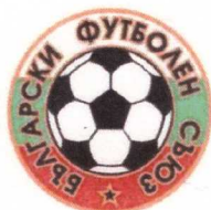
БЪЛГАРСКИ ФУТБОЛЕН СЪЮЗ