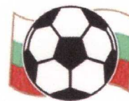
АСОЦИАЦИЯ НА БЪЛГАРСКИТЕ ФУТБОЛИСТИ